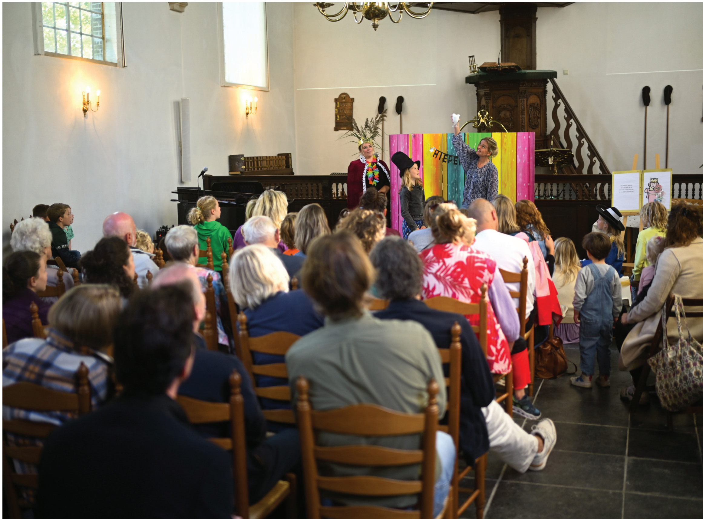
voorstelling Kindertheater Onwiz in de kerk

Volgende kerkklanken: 16 januari t/m 13 maart 2025 U kunt kopij inleveren tot 3 januari